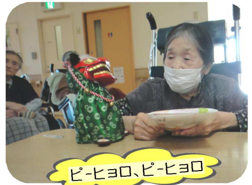
ピ-ヒョロ、ピ-ヒョロ

スーペリア360では、現在要介護1～5（平均3.2）の方が約100名入所中です。入所中の方は日常生活援助について理学療法士や作業療法士によるリハビリを受けています。おいしい食事や楽しいレクリエーションも喜んでいただいています。