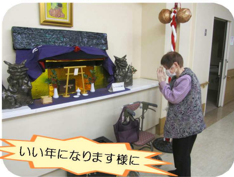
いい年になります様に