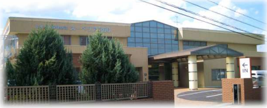
介護老人保健施設スーペリア360