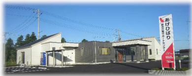
あげひばり リハビリデイサービス