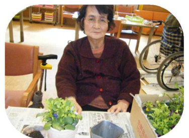
3月の誕生会です。7名の方をお祝いしました。