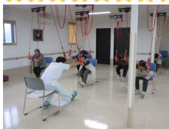
パワーリハビリの器具を使用したリハビリ