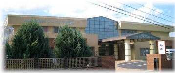
介護老人保健施設スーペリア360