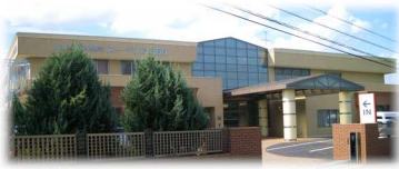
介護老人保健施設スーペリア360